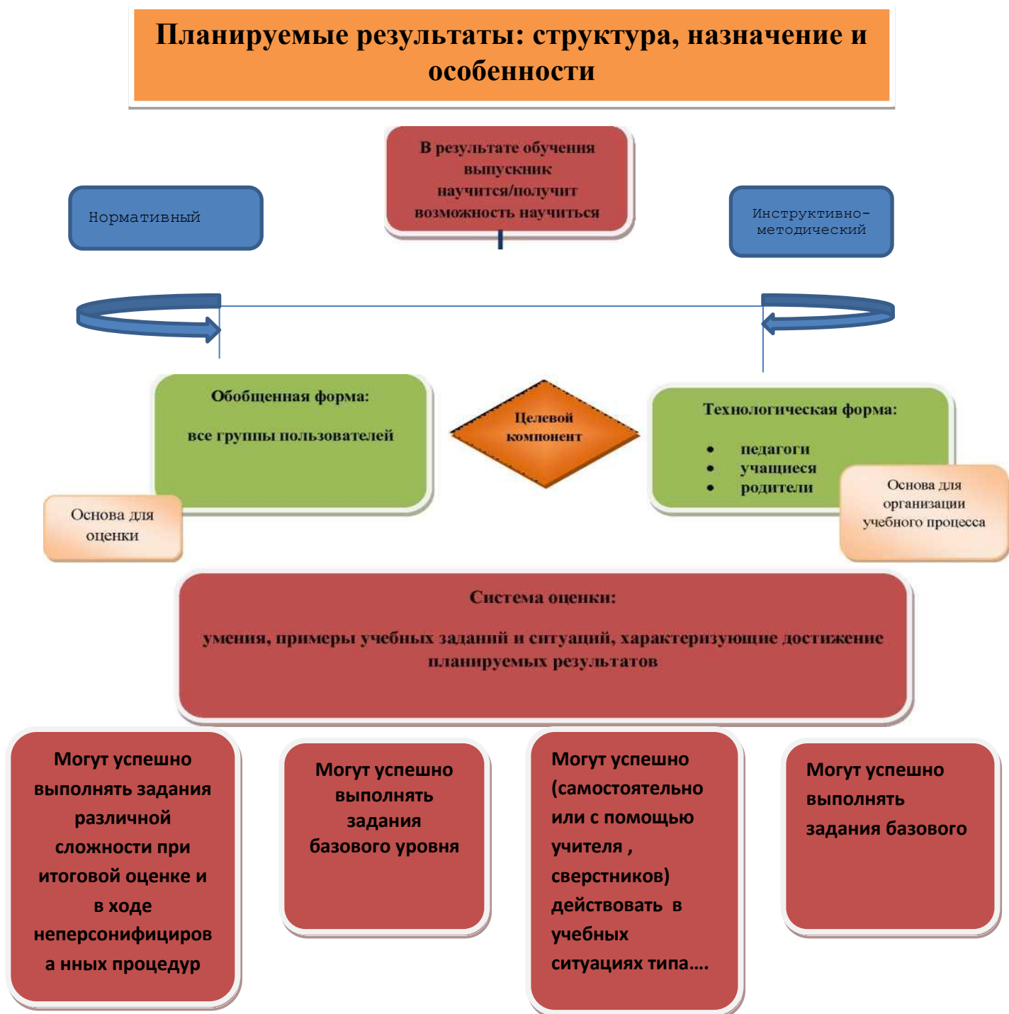
Рис. 1. Особенности структуры планируемых результатов. Функция и назначение.

Основными направлениями и целями оценочной деятельности в МБОУ Новоандрюновской сош в соответствии с требованиями ФГОС ООО являются: